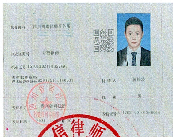
律师年度考核备案